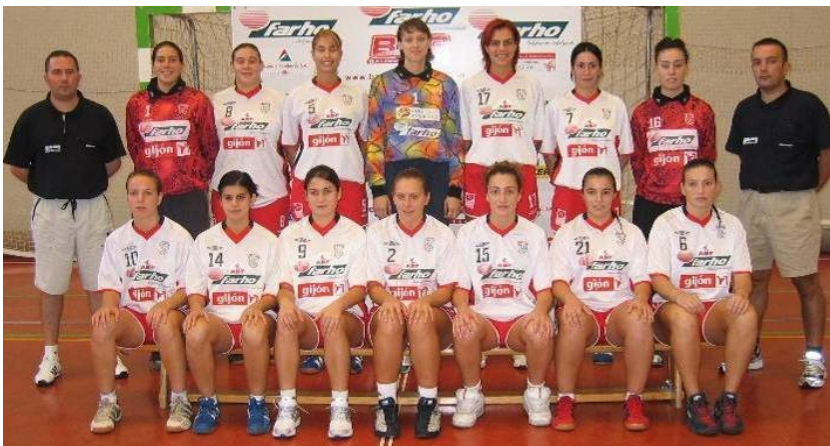
Equipo de División de Honor Femenina del Club Balonmano Gijón. Temporada 2004/2005