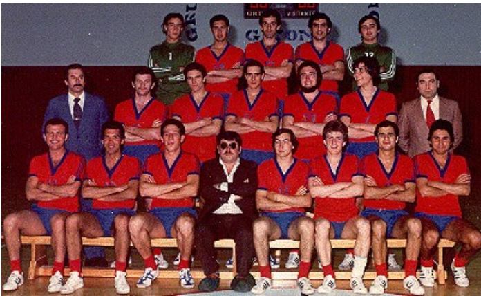
Equipo del Ascenso a División de Honor del Grupo Covadonga Temporada 1975/76

A lo largo de la historia, cinco clubes Asturianos han pertenecido a la máxima categoría del Balonmano Español: Grupo Covadonga , Villa de Avilés , Balonmano Naranco de Oviedo y A.D.Gijón Jovellanos en categoría masculina y el Deportivo Gijón Balonmano y Club Balonmano Gijón en categoría femenina.