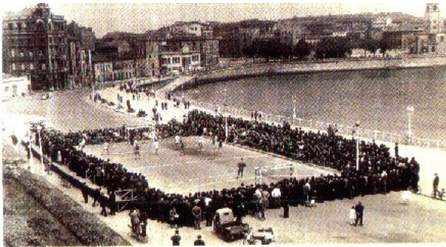
Partido celebrado en el año 1958, en una cancha instalada frente a la Playa de San Lorenzo en Gijón

La primera sede de la Federación Asturiana de Balonmano estaba situada en el número 20 de la populosa calle Corrida gijonesa, desde donde esta directiva organizó la primera competición para la difusión del Balonmano, y en la que participaron equipos asturianos de categoría absoluta y de fuera de nuestra región.