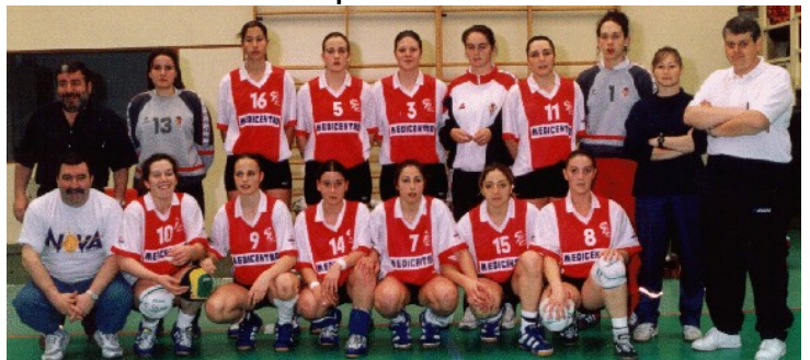
Equipo del Ascenso a División de Honor Femenina del Deportivo Gijón BM. Temporada 1998/99