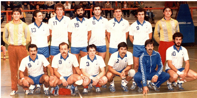
Equipo del primer Ascenso a División de Honor del Naranco Oviedo Temporada 1982/83