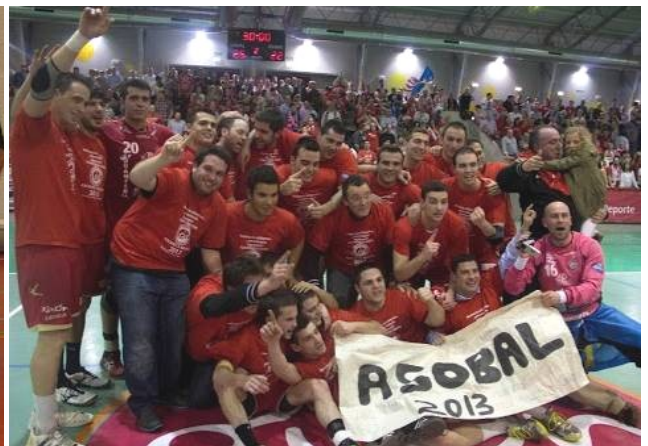
Ascenso del Gijón Jovellanos a Asobal en la temporada 2012/2013