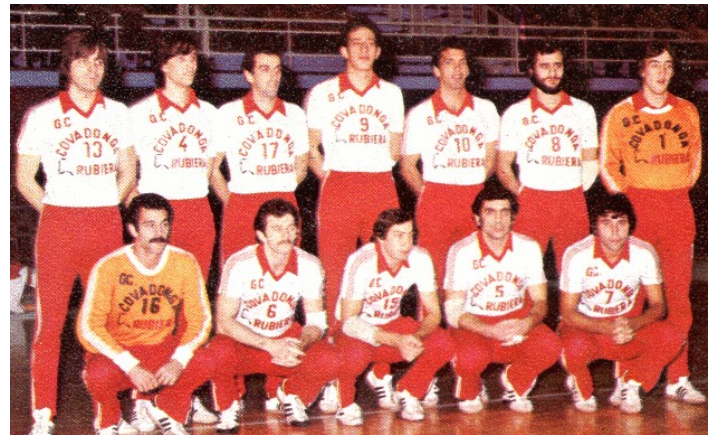
Grupo Covadonga de División de Honor Temporada 1976/77